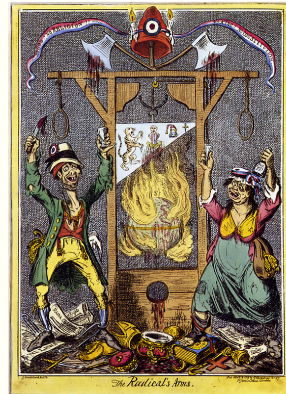
George Cruikshank, 1819

Copyright 2010 Alexandre Oliva (última modificação em outubro de 2010)